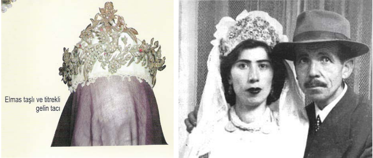
Elmas taşlı ve titrekli gelin tacı

Taçlar resimde görüldüğü gibidir .Ön kısmı üçgen olan bu taçlar, beyaz kumaşla kaplanarak modern manada taç görüntüsü verilmiştir. Üzeri genellikle elmas ve pırlantalar ile süslenmiştir. Özellikle “ yaylı dal ” adı verilen elmas ve gümüşten yapılmış yaka iğneleri (broşlar) bu tacın en önemli süslemelerindendir. Yan kısımlarında altınlar veya gümüş parçaları bulunur. Göze çarpmayan kısmında, genelde arkada olur, nazar boncuğu vardır. Tacın başa gelen kısmı inci veya beyaz boncuklar ile işlenmiştir. “ Titrekli ” diye adlandırılan bu taç, saça tokalar ile tutturulur ve düğünlerde, doğum ve günlerde kaftan ve bindallının üzerine takılır. Son zamanlarda hazırlanan taçların üzerinde akik, gümüş, altın, boncuk gibi aksesuarlar da vardır. Resimde görülen bu taç hemen hemen her gelinin şenlik ve kına gecelerinde giydiği bir aksesuardır. Bu durum özellikle eski elmaslı taçların kiralanması gibi sektör ortaya çıkarmıştır. Köklü ailelere ait çok süslü bu taçlar ve kıyafetler kiralanmakta ve daha sonra -genellikle ertesi gün- iade edilmektedir.