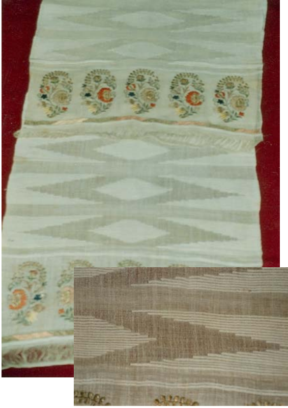
Peşkir – 1970’ li yıllar 50x160 cm (Tanyıldız, İ. Koleksiyonu ANKARA)