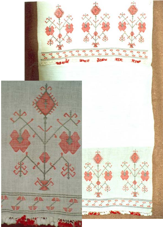
Peşkir – 1930’ lu yıllar. 43x100 cm (Tanyıldız, İ. Koleksiyonu ANKARA)

Şekil 2. Zemin dokuma ile aynı renkte, farklı cins ve kalınlıkta pamuk ipliği ile oluşturulmuş peşkir motifi.