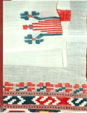
Şekil 5. Peşkir AKŞEHİR 1930' lı yıllar 46x180 cm (Tanyıldız, İ. Koleksiyonu ANKARA)