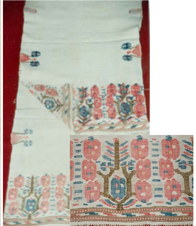
Peşkir AKŞEHİR 1920’ li yıllar. 41x148 cm (Tanyıldız, İ. Koleksiyonu ANKARA)

Şekil 3. Zemin dokuma ile farklı renkte, aynı kalınlıkta pamuk ipliği ile oluşturulmuş peşkir motifi.