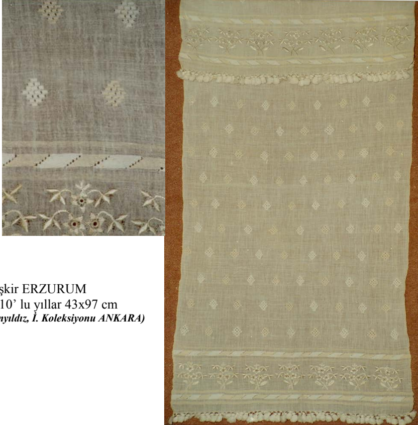
Şekil 7. Peşkir ERZURUM 1910' lu yıllar 43x97 cm (Tanyıldız, İ. Koleksiyonu ANKARA)