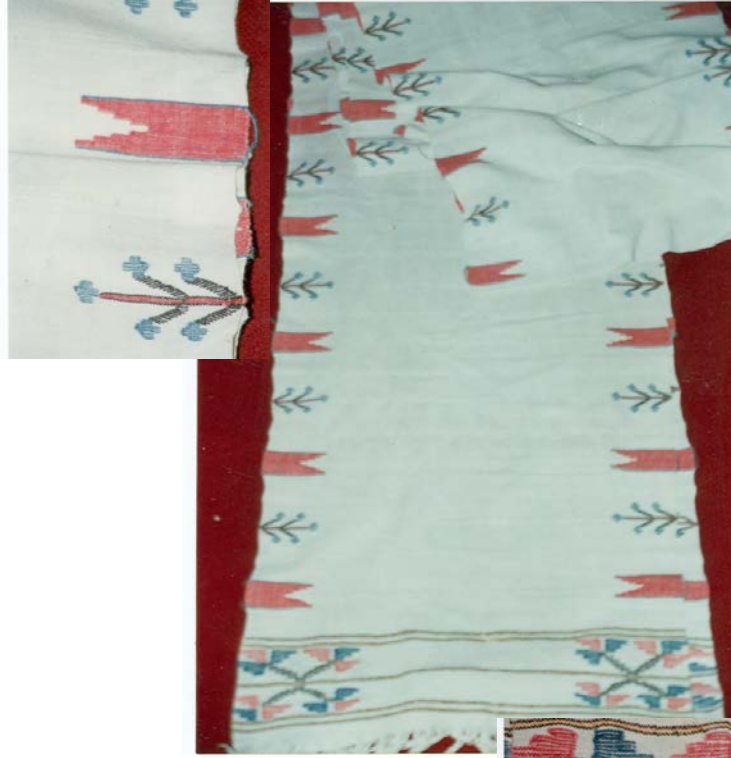
Şekil 4. Sofra Peşkiri DENİZLİ 1930' lu yıllar. 40x530 cm (Tanyıldız, İ. Koleksiyonu ANKARA)