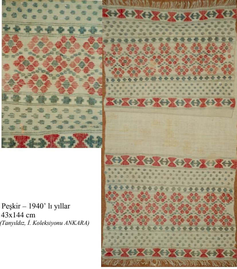
Şekil 6. Peşkir – 1940' lı yıllar 43x144 cm (Tanyıldız, İ. Koleksiyonu ANKARA)