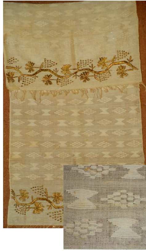
Peşkir SİNOP1930’ lu yıllar 50x130 cm (Tanyıldız, İ. Koleksiyonu ANKARA)

Şekil 2. Zemin dokuma ile aynı renkte, farklı cins ve kalınlıkta pamuk ipliği ile oluşturulmuş peşkir motifi.