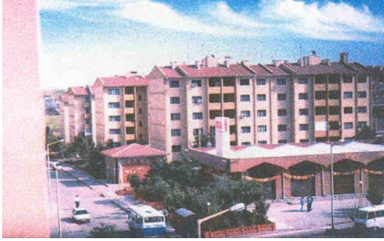
Resim 7: Sur dışındaki toplu konutlar

Sur dışı günümüz evleri yine kullanıcı gereksinimleri ve istekleri doğrultusunda az katlı dubleks, çok katlı apartmanlar ve toplu yerleşim bölgeleri olan toplu yaşamı tercih edenler için toplu konut siteleri şeklinde biçimlenmiştir.