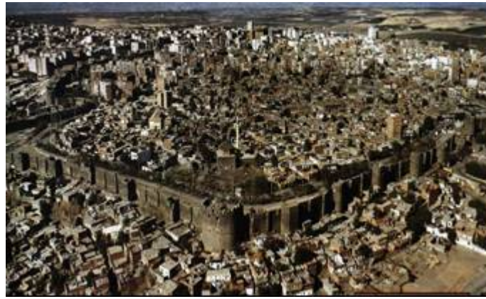
Resim1: Diyarbakir kenti sur içinden görünüş

Diyarbakır, Türkiye'nin güneydoğusunda yer alan bir il'dir. Antik çağlardan günümüze kadar kalan bir yandan Batı Dünyasını Doğuya ve Uzak Doğuya bağlayan öte yandan da Karadeniz'i Basra körfezine bağlayan, önemli ulaşım ve ticaret akslarının kesiştiği kavşak konumunda olması nedeni ile, dış dünya ile kültür, sanat, bilim ve ticaretin bir mübadele noktası olma özelliğine sahiptir.