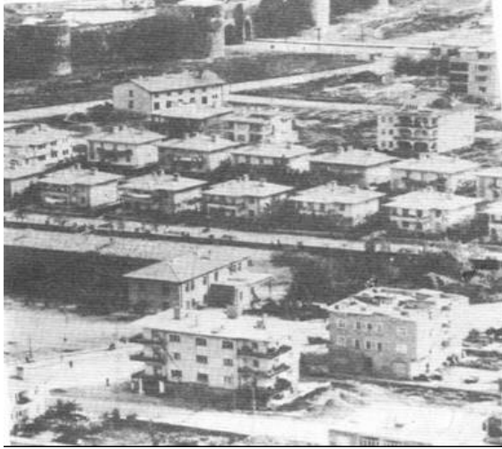
Resim 4: Sur dışında yapılan ilk konutlar

Oda sayısı da aile büyüklüğüne paralel olarak fazla değildir. Sur dışındaki evlerde aile yapıları değişmiş, çekirdek aileye dönüşüm gerçekleşmiştir. Bunun sonucunda evler küçülmüş, oda sayıları azalmıştır.