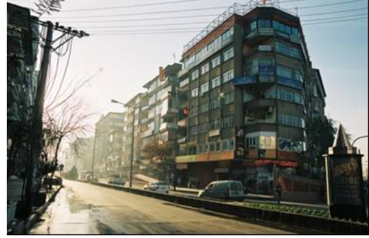
Resim 6: Sur dışındaki apartmanlar

Sur dışında sur içindeki sıkışıklık ve kapalılığa rastlanmamaktadır. Sur içindeki kapalı görünümüne karşın, sur dışında dışa, doğaya açılma belirgindir.