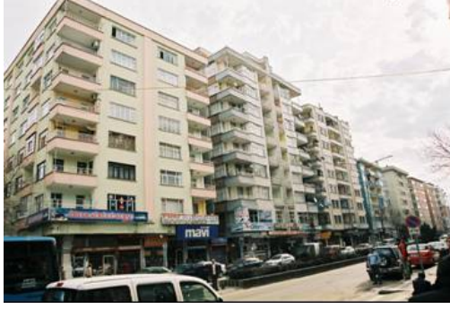
Resim 5: Sur dışındaki apartmanlar