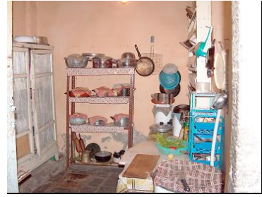
Resim 9: Kilerden görünüm