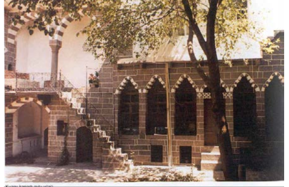
Resim 3: Geleneksel Diyarbakır evi “Avludan görünüm”

Diyarbakır’da Cumhuriyet sonrası dönemlerde Türkiye’nin yeni yapılanma hareketlerinde olması kenti asker ve memur nüfusu birikimiyle karşı karşıya bırakmıştır. Sur içinde ihtiyacı karşılayacak konutun bulunmaması nüfusu sur dışına taşırılmıştır (Özyılmaz, 2001). Sur dışında gelişmenin diğer yönü, demiryolunun gelmesi ve halkı buraya çekmeyi amaçlayan yapıların yapılması ve 1935 yılında başlatılan imar çalışmaları ile devam etmiştir.