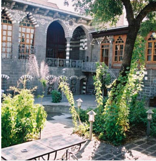
Resim 2: Geleneksel Diyarbakır evi “Avludan görünüm”

Geleneksel konut dokusunun oluşumunda surların sınırlayıcılığının ve mevcut malzemenin yanı sıra yaşama biçiminin ve dinin etkisinin de önemi büyüktür. Evler, yaz-kış sürekli kullanılan yapılardır (Cengiz, 1993). Yaşam yazın avlu ve eyvanlarda, kışın ise odalarda geçerdi. Bu evlerde çok sayıda oda mevcuttur. Oda sayıları evin zenginliğine göre değişmektedir.