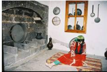
Resim 8: Mutfaktan görünüm