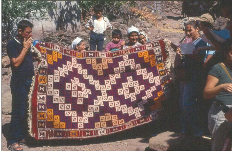
Fotograf 1. Çanakkale Ayvacı İlçesi Baharlar Köyü

Ortaçağ sonlarına kadar, resim, heykel, seramik, marangozluk, dokumacılık, oyunculuk, ticaret, tarım, hekimlik, ve dülgerlik gibi günlük yaşama yönelik hizmet işleri, ile ismarlama iş yapanların, sanat sayılmadığı mesleklerdi. Bu tür bayağı işler için okul açmaya gerek yoktu, beceri ve kurallara uyum yeterliydi. Köle ve hizmetçilerden oluşan halk, her nasılsa lonca ve ahi ocaklarında, usta ve kalfalardan mesleği öğreniyor ve para için iş yaparlardı. Bu mesleklerin dışında kalan, soyluluk, incelik, esin ve deha gerektiren; matematik, geometri, astronomi, felsefe, gramer, retorik, müzik, şiir gibi uğraşlar ise özgür, sanatsal alanlar olarak değerlendiriliyordu.