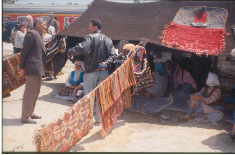
Fotograf 2. Uşak Eşme Kilim Festivali

Sanat eğitimi-öğrenimi yapılan yer olarak bilinen Akademi sözcüğü, Antikçağda, Platon'nun felsefe dersleri verdiği zeytinlik için kullanılmıştı. Antikçağ da kurulmuş olan beş Akademi'nin sonuncusu 529 yılında Bizans İmparatoru I. Justinian tarafından kapatılır. Rönesans'ta İtalya'da açılan felsefe ve edebiyat okulları için de Akademi adının kullanıldığı bilinir. Bugünkü anlamda ilk akademi 1459'da Floransa'da, Cosimo de Medici tarafından kurulan Akademi'dir. 15. yy.da resim eğitimi için matematik, geometri, perspektif, optik ve anatomi'nin gerekli olduğu söylenir. 1648'de Paris'te, Almanya'da 1662'de Nürnberg'te kurulan Akademilerin, sayıları gittikçe artar. Akademiler çoğaldıkça, Sanatçı Loncaları azalır. Bu nedenle Akademilerdeki sanat eğitime karşıt olanlar da az değildi. Fransız İhtilalinden sonra Akademik Sanat eğitiminin etkisi Fransa'da azalır. "Sanatçının temel kaynağı doğa'dır. Okullar insana bir şey öğretmez", "Sanatçılar entelektüel bilgi sahibi olmalı." gibi görüşler, sanatçıları ve sanat eğitimini yeni arayışlara yöneltir.