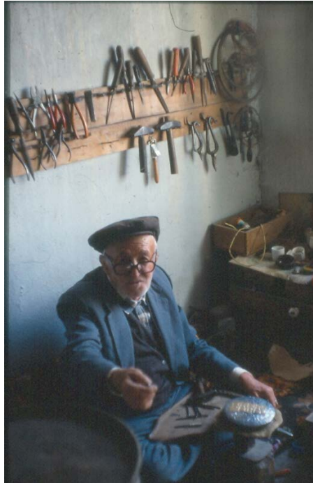
Fotograf 3. Manisa Demirci ilçesinde Tepelik Ustası

Sanat eğitimi-öğrenimi yapılan yer olarak bilinen Akademi sözcüğü, Antikçağda, Platon'nun felsefe dersleri verdiği zeytinlik için kullanılmıştı. Antikçağ da kurulmuş olan beş Akademi'nin sonuncusu 529 yılında Bizans İmparatoru I. Justinian tarafından kapatılır. Rönesans'ta İtalya'da açılan felsefe ve edebiyat okulları için de Akademi adının kullanıldığı bilinir. Bugünkü anlamda ilk akademi 1459'da Floransa'da, Cosimo de Medici tarafından kurulan Akademi'dir. 15. yy.da resim eğitimi için matematik, geometri, perspektif, optik ve anatomi'nin gerekli olduğu söylenir. 1648'de Paris'te, Almanya'da 1662'de Nürnberg'te kurulan Akademilerin, sayıları gittikçe artar. Akademiler çoğaldıkça, Sanatçı Loncaları azalır. Bu nedenle Akademilerdeki sanat eğitime karşıt olanlar da az değildi. Fransız İhtilalinden sonra Akademik Sanat eğitiminin etkisi Fransa'da azalır. "Sanatçının temel kaynağı doğa'dır. Okullar insana bir şey öğretmez", "Sanatçılar entelektüel bilgi sahibi olmalı." gibi görüşler, sanatçıları ve sanat eğitimini yeni arayışlara yöneltir.