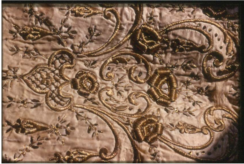
Fotograf 4. Dival İşleme Bindallı (Bahkesir-Gönen)

Ülkemizde, Batı etkisinde sanat ve bu konudaki eğitim kuruluşu, saray ve yönetici kesimince kuruldu. Avrupa örneklerinden 220 yıl sonra 1883 yılında Mithat Paşa desteğinde, Osman Hamdi Bey başkanlığında, dönemin Ticaret Bakanlığı’na bağlı olarak İstanbul’da sanat eğitimi vermek amacıyla; Sanayi-i Nefise Mektebi Alisi açılır. Bu okul üç yıl sonra dönemin Eğitim Bakanlığı’na bağlanır. Resim, heykel ve hakkak’lık (oymacılık) eğitimi için açılan okulda, yabancı hocalar çoğunlukta idi. Hakkak’lık kısmına hoca bulunamadığı için kapatılır. Öğrenim süresi 30 yaş ile sınırlıydı. 1914 yılında ise Sanayi-i Nefise Mektebi Ali’nin kızlar kısmı (İnas) açılır. Bu okullarda, Batı’daki örneklerinden aktarmalar doğrultusunda eğitim veriliyordu. Perspektif yanılısamalı, fotografik gerçeklikte resim örnekleri ülkeye taşınıyordu. Minyatür, tezhip, hat gibi Saray Sanatı kapsamındaki, sanatlar öğretilmezdi. Bu eksikliği gidermek amacıyla Sanayi-i Nefise’den yaklaşık 30 yıl sonra Medresetül Hattatin adında şark ve saray sanatlarına yönelik derslerin verildiği bir okul açılır. Burada Halı Nakkaşlığı kısmı olduğu söz edilse de Halk Sanatı, her iki okulda da söz konusu değildi.